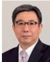
代表取締役 副会長執行役員