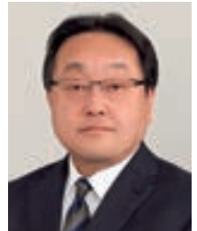
代表取締役社長 社長執行役員